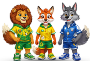
CENTRO ESTIVO PRIMARIA