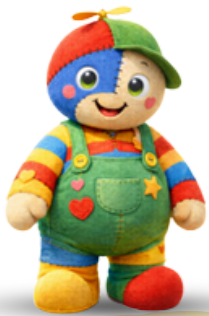
CENTRO ESTIVO INFANZIA